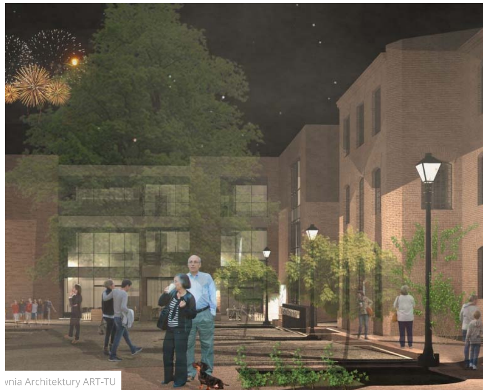
wnia Architektury ART-TU

Pracownia Architektury ART-TU wygrała konkurs na adaptację budynku "Starego Młyna" oraz budowę nowej części obiektu łączącej funkcje: Młodzieżowy Dom Kultury oraz Miejski Ośrodek Kultury w Zgierzu. Powstanie nowoczesne miejsce kultury nawiązujące jednocześnie do zabytkowej strefy miasta i walorów obiektu Młyna.